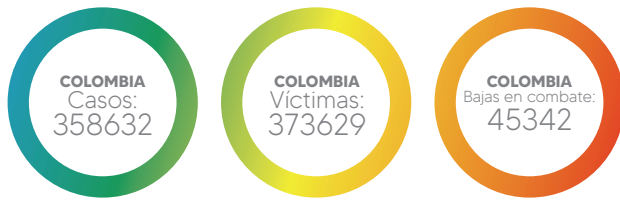
FIGURA 1. CASOS (HECHOS VIOLENTOS), VÍCTIMAS Y BAJAS EN COMBATE DESDE 1958

(Observatorio de Memoria Histórica y Conflicto, 2022).